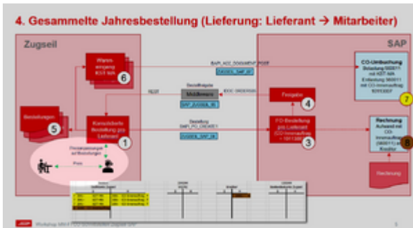
RhB Prozess 4 - Erweiterung Pool Manager

Erweiterung des Pool Managers: Es gibt die Möglichkeit bei zurückgehaltenen Purchase Orders, die EK-Preise poolspezifisch zu ändern.